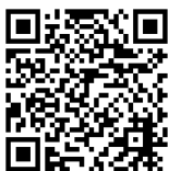
1 緊急輸送道路沿道建築物