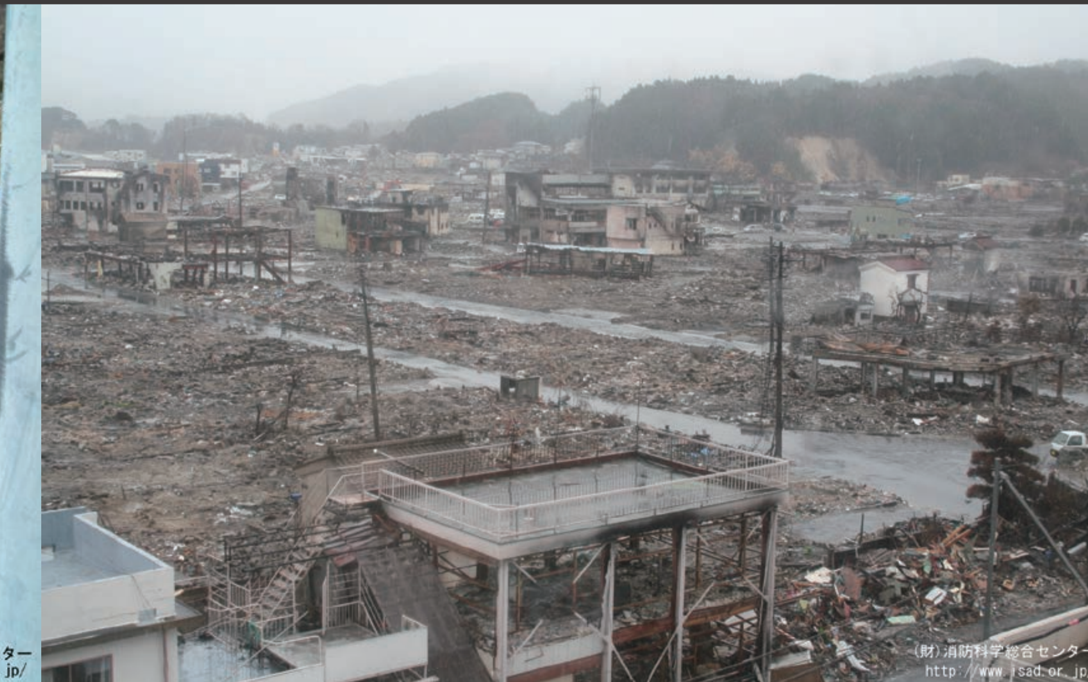
(財)消防科学総合センター http://www.isad.or.jp/