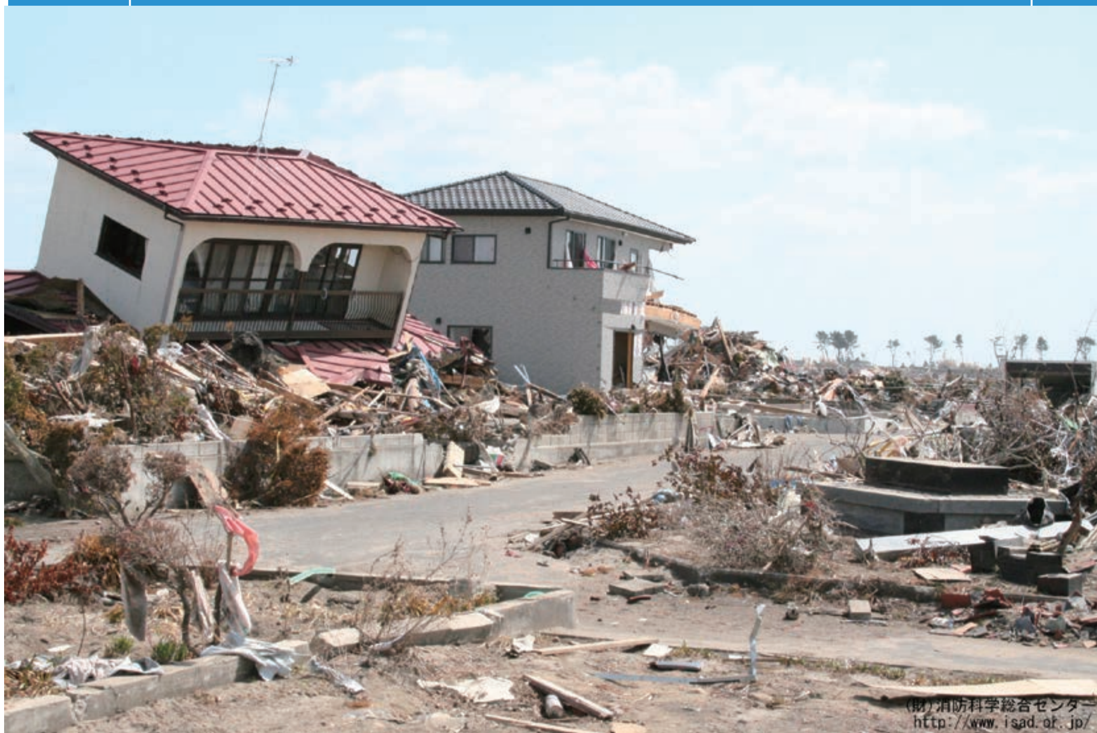
(財)消防科学総合センター http://www.isad.or.jp/