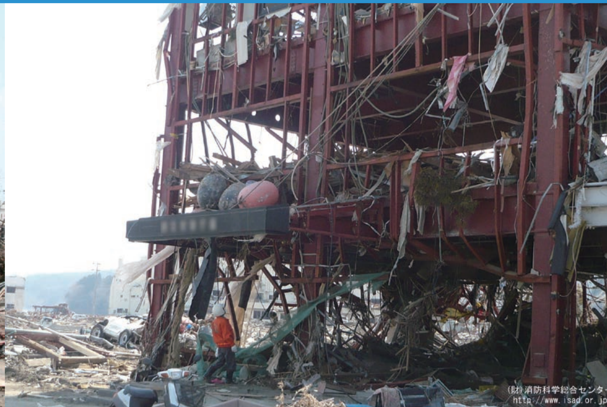
(財)消防科学総合センター http://www.isad.or.jp/