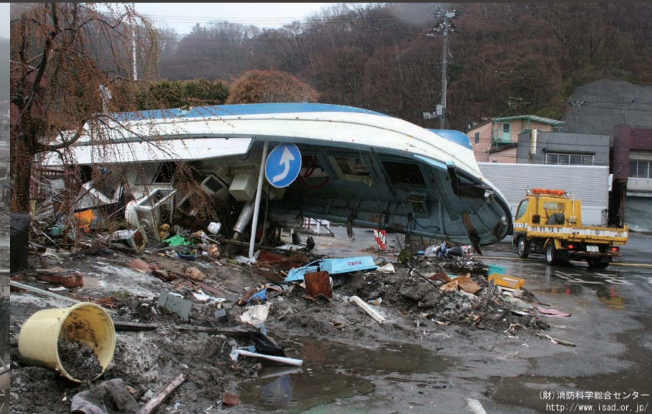
(財)消防科学総合センター http://www.isad.or.jp/