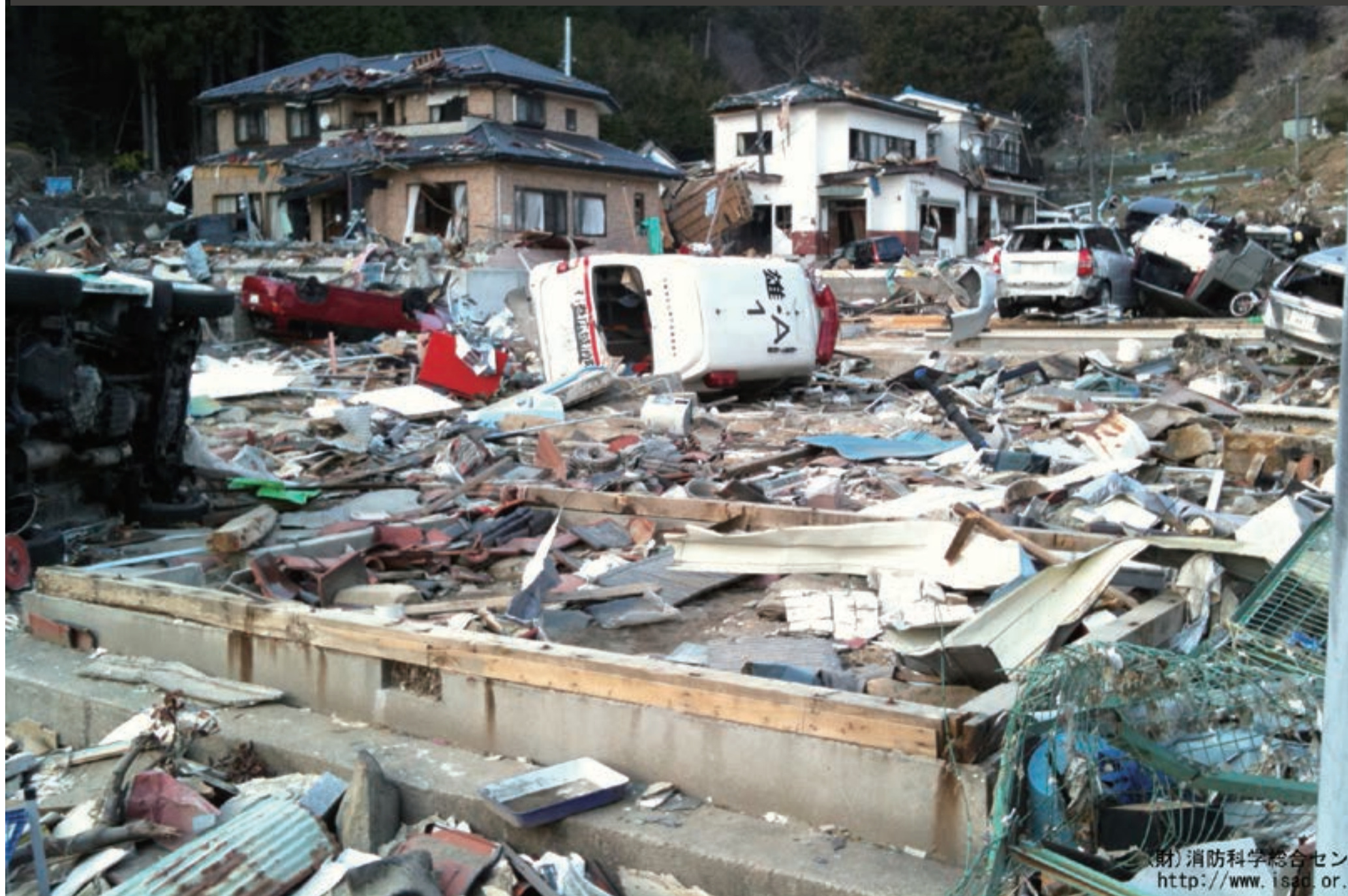
(財)消防科学総合センター http://www.isad.or.jp/