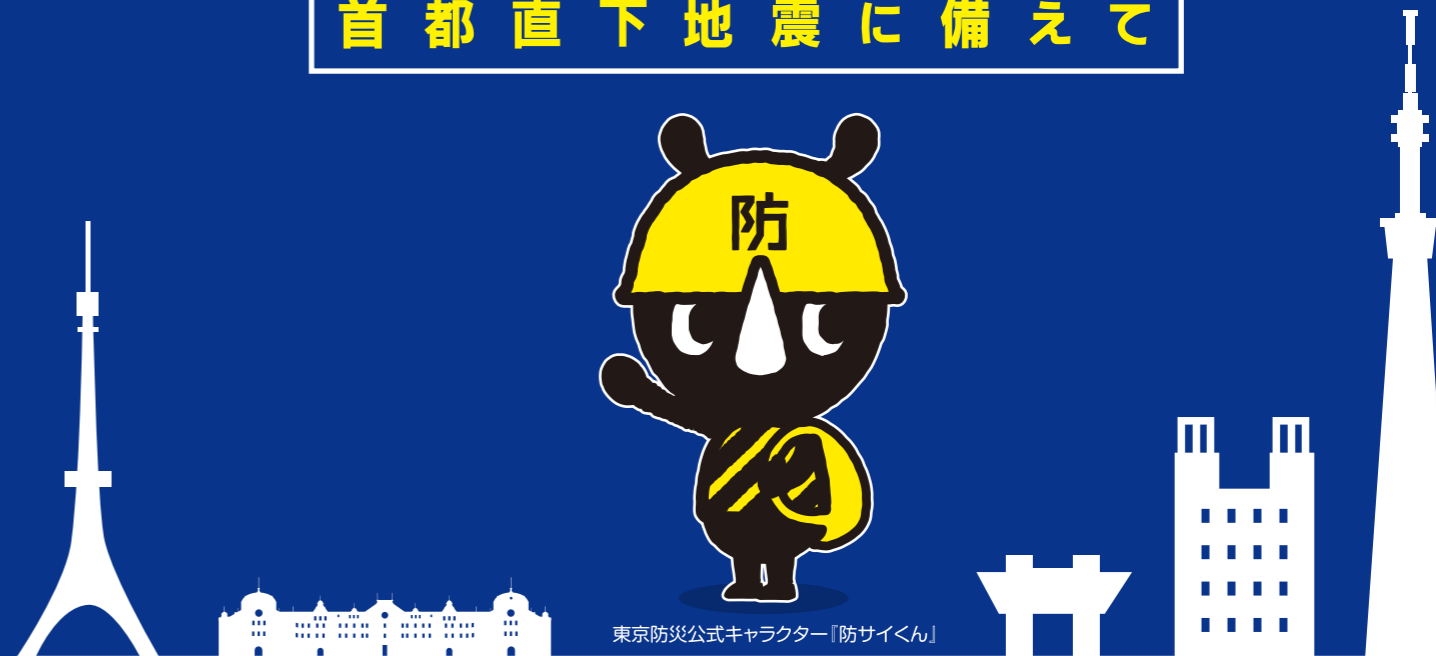
東京防災公式キャラクター「防サイくん」