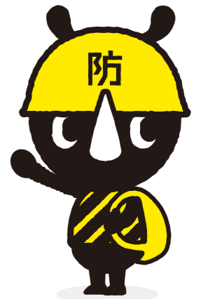
東京防災公式キャラクター「防サイくん」

問い合わせ先：東京都住宅政策本部民間住宅部マンション課 マンション耐震化担当 Tel: 03-5320-4944